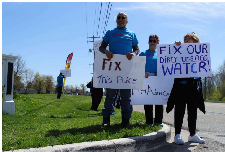
North Morris Estates residents protest "terrible" living conditions

Following the LCT, a group of leaders went up to North Morris Estates near Flint, MI, to support a protest against the living conditions and abuses in an unlicensed Homes of America-owned park. Residents have already begun voicing their concerns on local news outlets. Click HERE to see more!