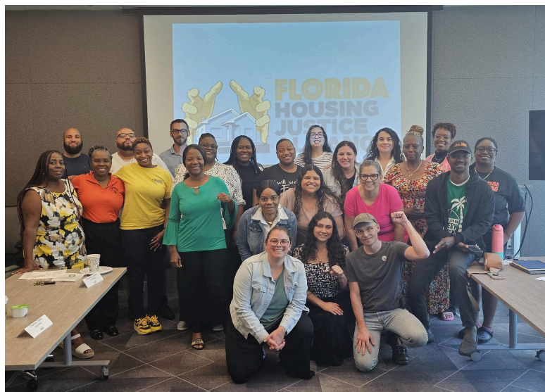
MHAction with the Florida Housing Justice Alliance in Miami

On April 15 and 16, Florida resident leaders and members of the Florida Housing Justice Alliance convened in Miami. During the event, we discussed organizing efforts and housing justice legislation for renters and manufactured housing residents. We look forward to continue bolstering resident protections in the Sunshine State!