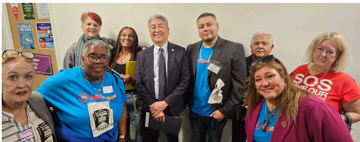
Líderes y miembros del personal de MHAction reunidos con Al Muratsuchi, patrocinador del proyecto de ley AB 2778

El 29 de abril, los residentes líderes y el personal de MHAction acompañaron a Housing Now! en su Día de Acción en Sacramento con el fin de unir esfuerzos a favor de la protección de los inquilinos y de los residentes de viviendas prefabricadas. Tuvimos la oportunidad de reunirnos con el patrocinador del proyecto de ley AB 2778 , Al Muratsuchi, para compartir nuestras historias y discutir su proyecto de ley, el cual crearía un monto límite para los alquileres de los residentes de viviendas prefabricadas en todo el estado.