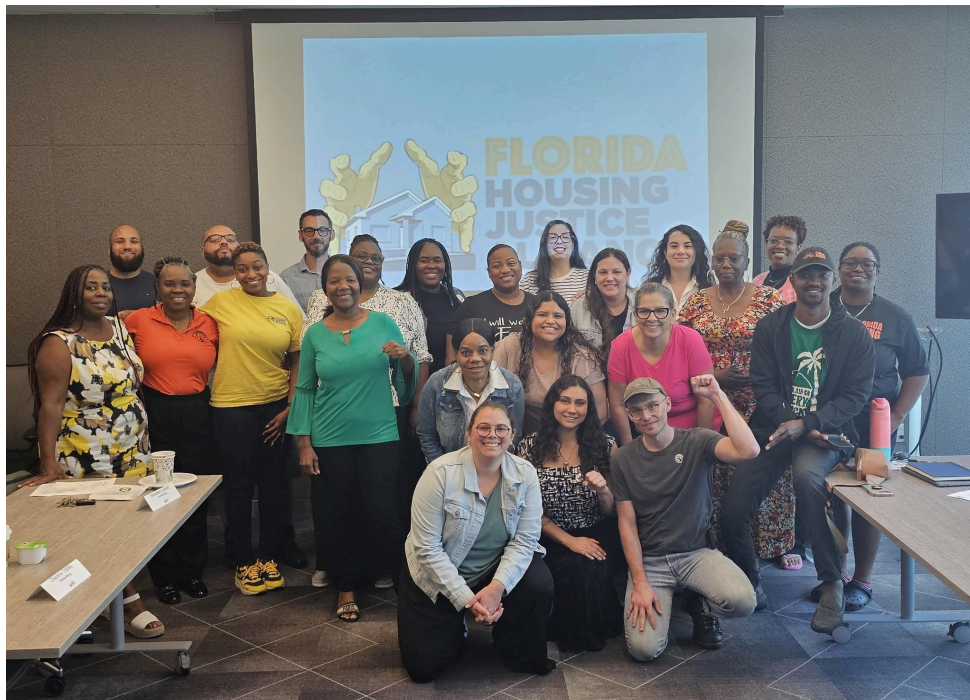
MHAction con Florida Housing Justice Alliance en Miami

Los días 15 y 16 de abril, varios residentes líderes de Florida y miembros de Florida Housing Justice Alliance se reunieron en Miami. Durante el evento, discutimos los esfuerzos de organización y la legislación de justicia en materia de vivienda para los inquilinos y los residentes de viviendas prefabricadas. Esperamos seguir ampliando las protecciones de los residentes en el "Estado del sol".