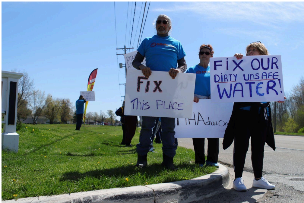
Residentes de North Morris Estates marchan en protesta por las "terribles" condiciones de vida de su complejo

Al término de la capacitación, un grupo de líderes se dirigió a North Morris Estates, cerca de Flint, MI, para apoyar una protesta contra las condiciones de vida y los abusos en un parque sin licencia propiedad de Homes of America. Los residentes ya comenzaron a exponer sus preocupaciones ante los medios de comunicación locales. ¡Hacer clic AQUÍ para obtener más información!